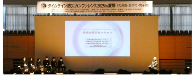
標津高校/大洲高校/野村高校 生徒6名 河田恵昭 関西大学特別任命教授