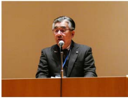
二宮隆久 大洲市長