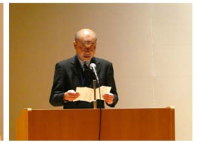
中川逸朗 愛媛県知事代理