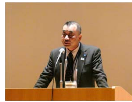
豊口佳之 四国地方整備局長